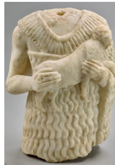
Buste d'un porteur de chevreau (Mari, zone des temples)

Pour donner au public un aperçu aussi complet que possible des sources qui nous replongent dans cette cité magnifique, la Bnu a sollicité le prêt d'une pièce du Vorderasiatisches Museum Berlin : la tête sculptée d'un des rares "Shakkanakkus" connus, du nom de Puzur-Ishtar (ci-contre). Faire venir et présenter cette statue, ainsi que les autres pièces majeures de l'exposition, dans les conditions adéquates, est un enjeu financier important pour lequel la Bnu recherche des soutiens à hauteur de 15 000 €.