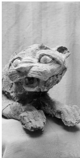
Photographie de la découverte d'une statue de lion en 1936/1937 Archives AP205_2538

Mais Mari est aussi une incroyable aventure archéologique depuis 1933. Suite à une découverte fortuite, André Parrot, conservateur au musée du Louvre, conduira jusqu'en 1974 une mission archéologique qui révélera au monde entier une cité disparue. À partir des années 60, l'Université de Strasbourg sera de la partie, notamment par le biais de la figure de Jean-Claude Margueron, professeur à l'Université de Strasbourg et directeur de la mission à partir de 1979. Ce n'est qu'avec la dégradation de la situation en 2011 qu'ont cessé les fouilles. Les archives de cette mission seront amplement présentées dans l'exposition, pour mieux comprendre les chefs-d'œuvre exposés dans leur contexte d'origine.